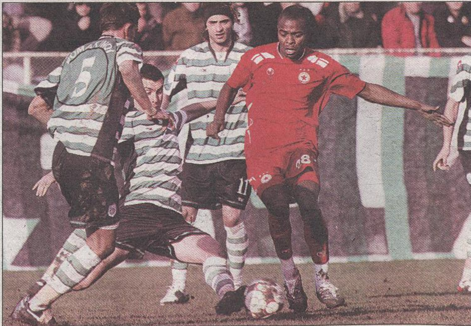
На турнира в Албена шампионите с лекота надиграха силния тим на Черно море, който е раздубан до небесата от медуите като скрит фаворит